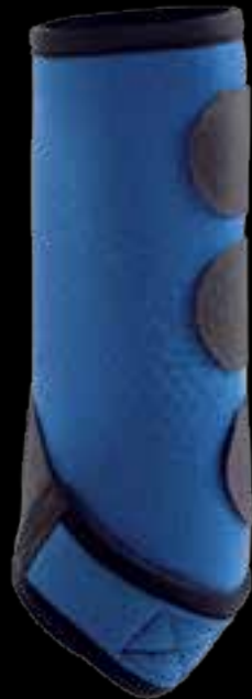
FRONT / VORDERGAMASCHE AC652