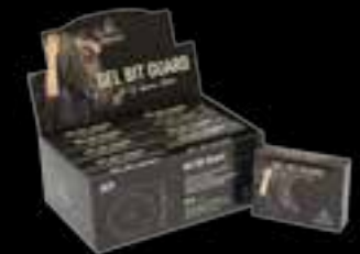
Delivered in table displays of 10 pairs Tisch-Display mit 10 Paaren