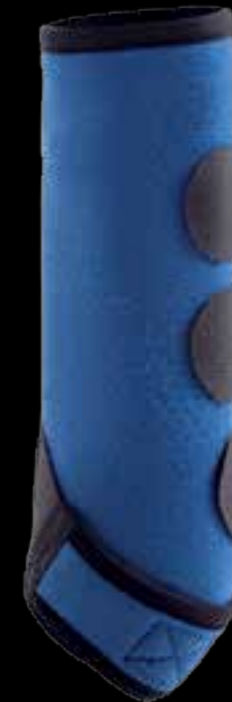
REAR / HINTERGAMASCHE AC653